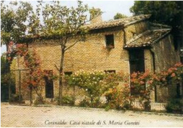
Casa Natale di Santa Maria Goretti a Corinaldo