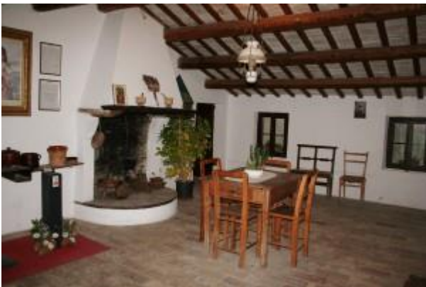
La Casa Natale di S. Maria Goretti a Corinaldo – Interno