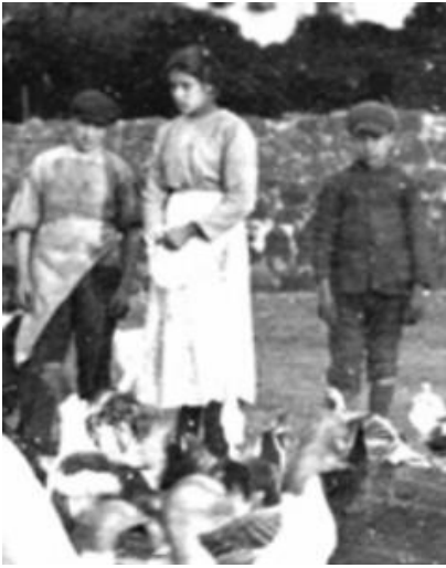
Presunta foto di Maria Goretti del 1902